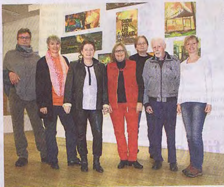
Die „Kunstnetz“-Mitglieder zeigen eine Auswahl ihrer Bilder zum Thema Angst

• Mehr Informationen gibt es im Internet unter www.kunstnetz-jesteburg.de .